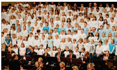
ÉCOLIERS ET ESN Une exécution confiante.

Grande est la responsabilité de ceux qui ont la charge de susciter