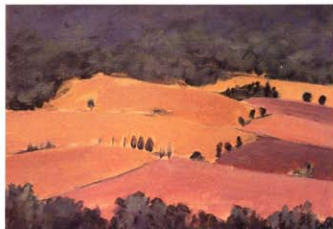
La macchia della Magona, 30 x 40 cm.

Les forêts touffues ne sont pas absentes de cette région ; ainsi ce paysage de Toscane avec le « maquis » en arrière-fond, et toujours cette terre ocre, l'espace, les grands champs.