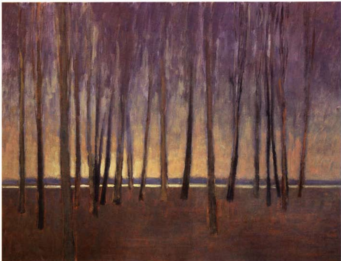
Rive boisée, 80 x 100 cm.