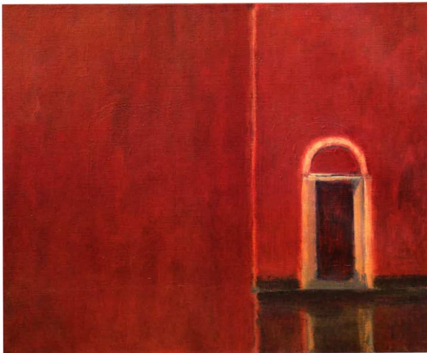
Porte vénitienne, 60 x 70 cm.