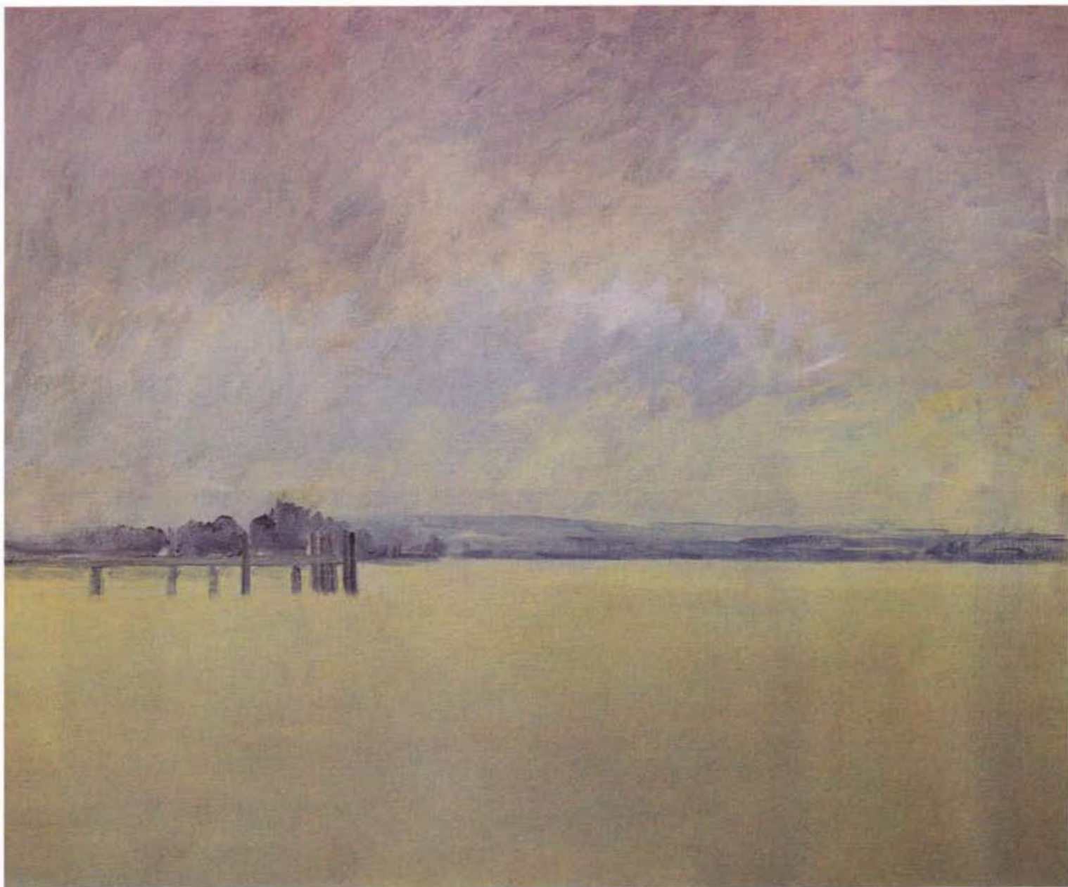
Embarcadère, 100 x 120 cm.

Plus que jamais les tableaux de Daniel Aeberli nous font pénétrer dans un univers d'espace, de sérénité, de plénitude. La lumière y occupe toujours une place prépondérante, l'espace y est travaillé au gré des endroits dont le peintre s'inspire au cours des longues promenades faites avec ses chiens dans la nature, ici, dans les forêts des alentours, au bord du lac, le long des chemins de vignes ou encore en Valais, à Venise ou en Toscane. Toujours il observe, il s'imprègne des ambiances particulières ressenties au plus profond de lui-même, sa mémoire les retenant et, une fois dans son atelier, face à sa toile, il restitue l'essentiel de ce qui l'a touché.