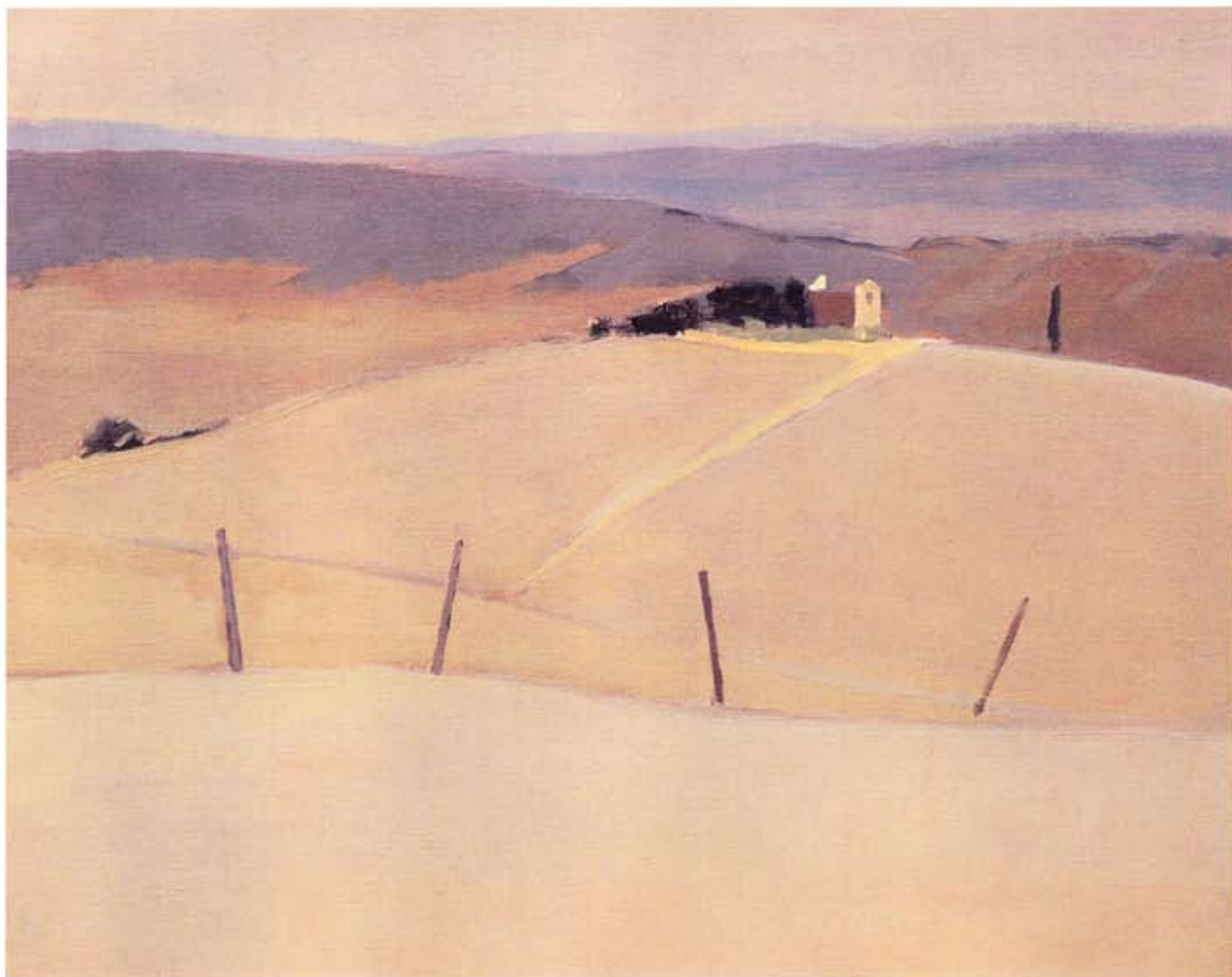
Sur la route de Volterra, 50 x 60 cm.

En 2006 pourtant, il décide de quitter Saint-Blaise et son grand atelier, pour passer quelques mois en Italie et y capter l'atmosphère et les lumières si particulières à ces terres. Mais quel endroit privilégier ? Venise, où il a déjà séjourné à diverses reprises et qui l'attire toujours ? Finalement il préférera la Toscane à la Cité des Doges, parce qu'elle lui offre des paysages beaucoup plus terriens. Que de promenades effectuées avec ses chiens, à parcourir ces terres toscanes, inlassablement, découvrant des fleurs, des oiseaux, des plantes et cette lumière si particulière à la région ! Il s'y installe du printemps au début de l'été, y retourne en automne pour y capter les lumières et les atmosphères propres aux différentes saisons. Encore une fois l'espace, la lumière, les changements d'ambiance le fascinent et il n'a de cesse de rendre sur ses toiles toutes ces impressions recueillies au fil des jours, à l'image de cette forêt de chênes située sur des ruines étrusques près de Casale, qu'il considère comme un endroit sacré. (Voir page de couverture).